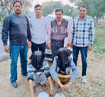
फतेहाबाद। हथियारों सहित गिरफ्तार दोनों युवक