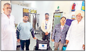
हिसार। मूलभूत सुविधाएँ पीएचसी को सम्पन्न करते बैंक अधिकारी।