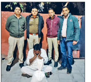
सिरसा। पुलिस गिरफ्तार में चूरापोस्त तस्कर।