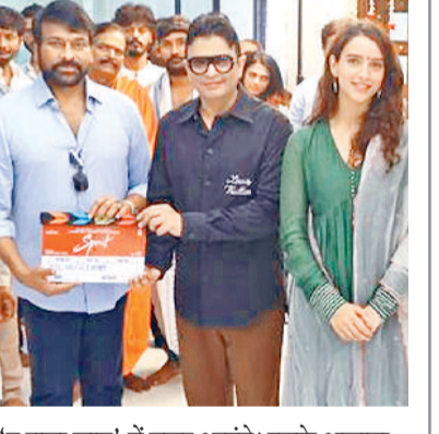
'द राजा साब' में नजर आएंगे। इसके अलावा तृप्ति डिमरी मुख्य भूमिका में नजर आएंगी। इस फिल्म में प्रभास और तृप्ति के अलावा विवेक ओबेरॉय और प्रकाश राज भी अहम भूमिकाओं में नजर आएंगे। प्रभास के फैस 'स्पिरिट' की रिलीज का बेसब्री से इंतजार कर रहे हैं। प्रभास

मुंबई। साउथ स्टार प्रभास इन दिनों हॉरर-कॉमेडी फिल्म 'द राजा साब' को लेकर लगातार सुर्खियों में बने हुए हैं। प्रभास, संदीप रेड्डी वांगा और भूषण कुमार की आगामी फिल्म 'स्पिरिट' की शूटिंग का पहला शेड्यूल रविवार से शुरू हो चुका है। फिल्म के मुहूर्त समारोह की कुछ तस्वीरें इंस्टाग्राम पर सामने आई हैं। मुहूर्त पूजा में 'स्पिरिट' की मुख्य टीम मौजूद दिखाई। जिसमें चिरंजीवी विशेष अतिथि के रूप में शामिल हुए। इस फिल्म का निर्देशन संदीप रेड्डी वांगा कर रहे हैं। फिल्म की मुख्य कलाकार तृप्ति डिमरी भी मुहूर्त पूजा में शामिल हुईं। हालांकि, मुहूर्त पूजा की इन तस्वीरों में प्रभास नजर नहीं आए। 'स्पिरिट' में प्रभास के अलावा तृप्ति डिमरी मुख्य भूमिका में नजर आएंगी। इस फिल्म में प्रभास और तृप्ति के अलावा विवेक ओबेरॉय और प्रकाश राज भी अहम भूमिकाओं में नजर आएंगे। प्रभास के फैस 'स्पिरिट' की रिलीज का बेसब्री से इंतजार कर रहे हैं। प्रभास