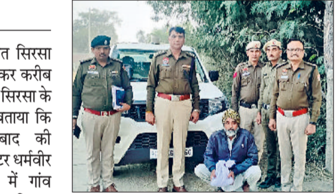
सिरसा। पकड़ा गया अफीम तस्कर।