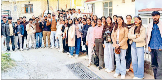
हिसार। शिमला में फील्ड सर्वे करने वाली विद्यार्थियों की टीम।