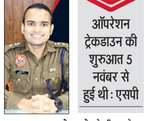
ऑपरेशन ट्रैकडाउन की शुरुआत 5 नवंबर से हुई थी: एसपी