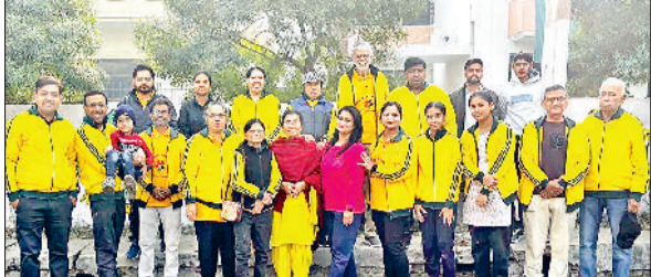
हिसार। हमारा प्यार-हिसार की टीम।