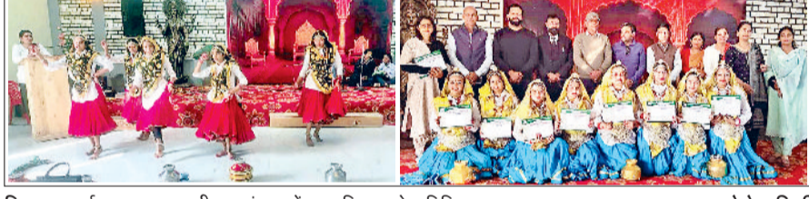
हिसार। कार्यक्रम प्रस्तुत करती छात्राएं व उन्हें सम्मानित करते अतिथि।