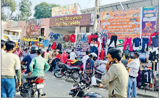
फतेहाबाद। मल्टीलेवल पार्किंग के बाहर अवैध अतिक्रमण कर लगाई गई फड़ियां तथा मल्टीलेवल पार्किंग के बाहर थाना रोड पर लगा जाम।

शहर के थाना रोड पर लोगों की सुविधाओं के लिए बनाई गई मल्टीलेवल पार्किंग ही अब जाम का मुख्य कारण बन चुकी है। होना तो यह चाहिए था कि पार्किंग बनने के बाद लोगों को बाजार में भीड़भाड़ का सामना न करना पड़ता लेकिन हो रहा है इसके विपरीत। पार्किंग के बाहर इतने कब्जे हैं कि पार्किंग के गेट को भी नगरपरिषद ने फड़ी लगवाकर बंद करवा दिया है। अब हालात यह हैं कि पूरा दिन थाना रोड पर जाम लगा रहता है। रविवार को भी बाजार में सेल के नाम पर लगी स्टालों के कारण लंबा जाम लगा रहा। एक एम्बुलेंस भी इस जाम में फंस गई। शहर की ट्रैफिक व्यवस्था सुचारू करने का दम भरने वाले ट्रैफिक पुलिस कर्मचारी भी रविवार को थाना रोड से गायब नजर आए और लोग अपने स्तर पर जाम खुलवाने के प्रयास करते दिखे। कुछ साल पहले थाना रोड पर वाहनों की बढ़ती संख्या को देखते हुए नगरपरिषद द्वारा यहां कार्रवाई रूपे खर्च कर मल्टीलेवल