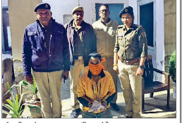
अवैध हथियार के साथ पकड़ा गया वांछित आरोपी।