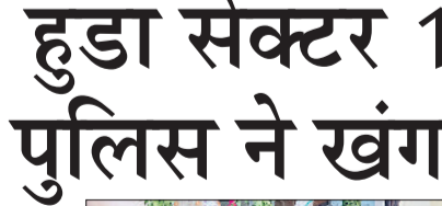
सिरसा। हुडा सेक्टर के फ्लैटों में सर्व अभियान के तहत तलाशी लेते पुलिस कर्मचारी।

भी कानूनी कार्रवाई की जाएगी। उन्होंने बताया कि सर्च अभियान का उद्देश्य विभिन्न प्रकार के नशे का कारोबार करने वाले लोगों पर कारगर दंग से अंकुश लगाना है।